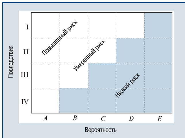
▲ Рис. 3. Матрица риска

Зоны риска. Риск группируют по зонам (см. рис. 3) для облегчения передачи информации о нем и принятия более эффективных и структурированных решений. В верхнем левом углу расположена зона наибольшего риска. По диагонали проходят зоны среднего риска, а в правом нижнем углу находится зона наименьшего риска.