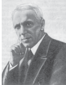
▲ Проф. А.А. Скочинский